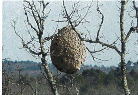
Abbildung 2: Nest in Baumkrone

Bitte melden Sie verdächtige Nester und Insekten (mit Bild und Koordinaten) an: