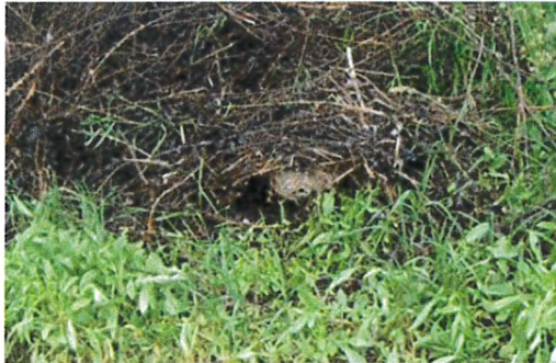
Abbildung 1: Vornest im Frühling http://www.hornissenschutz.ch/vespa-velutina-nth.htm