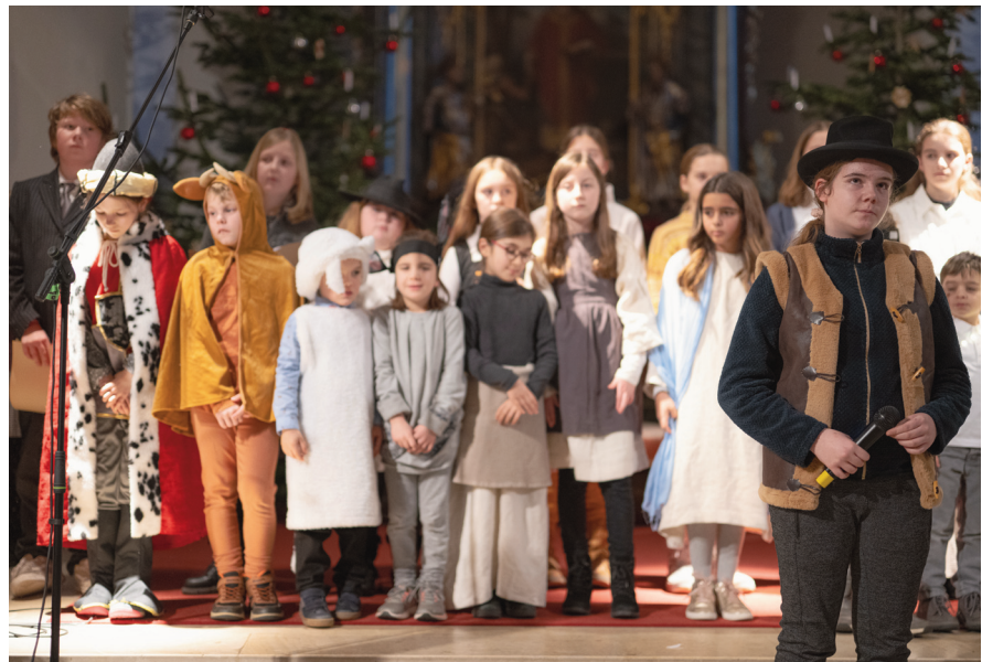
Aufführung des Krippenspiels in Büren. Mit dabei: Könige, Hirten und Schafe.