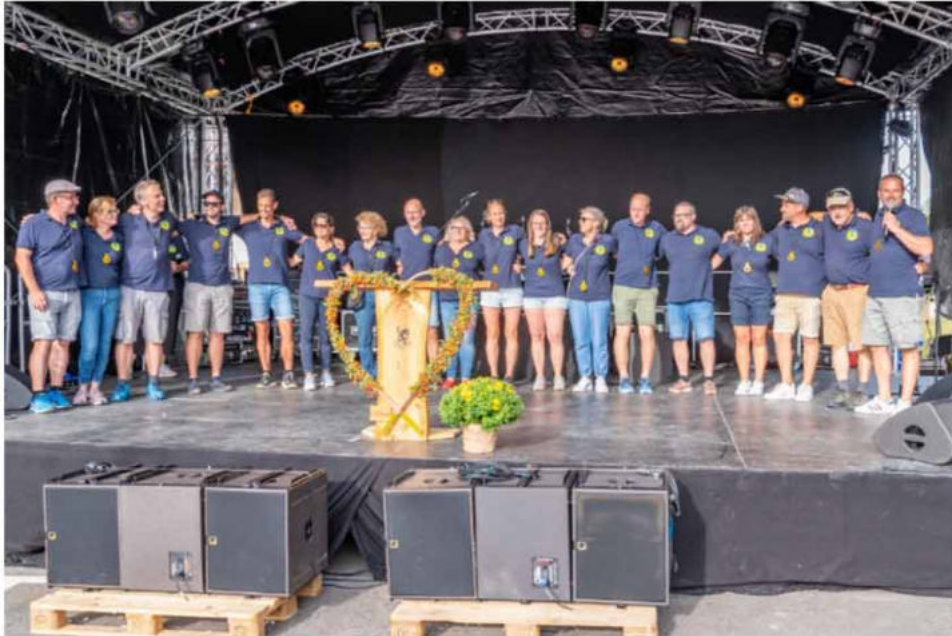
OK Dorffest Lupsingen