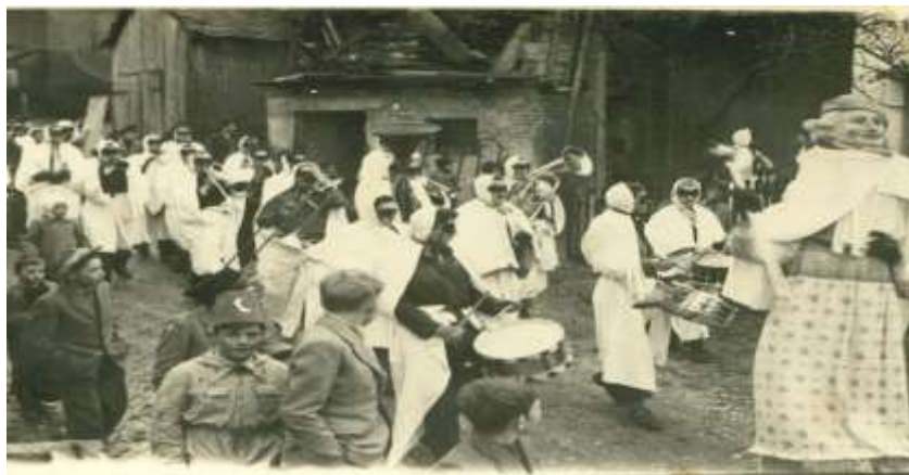
1. Umzug 1954