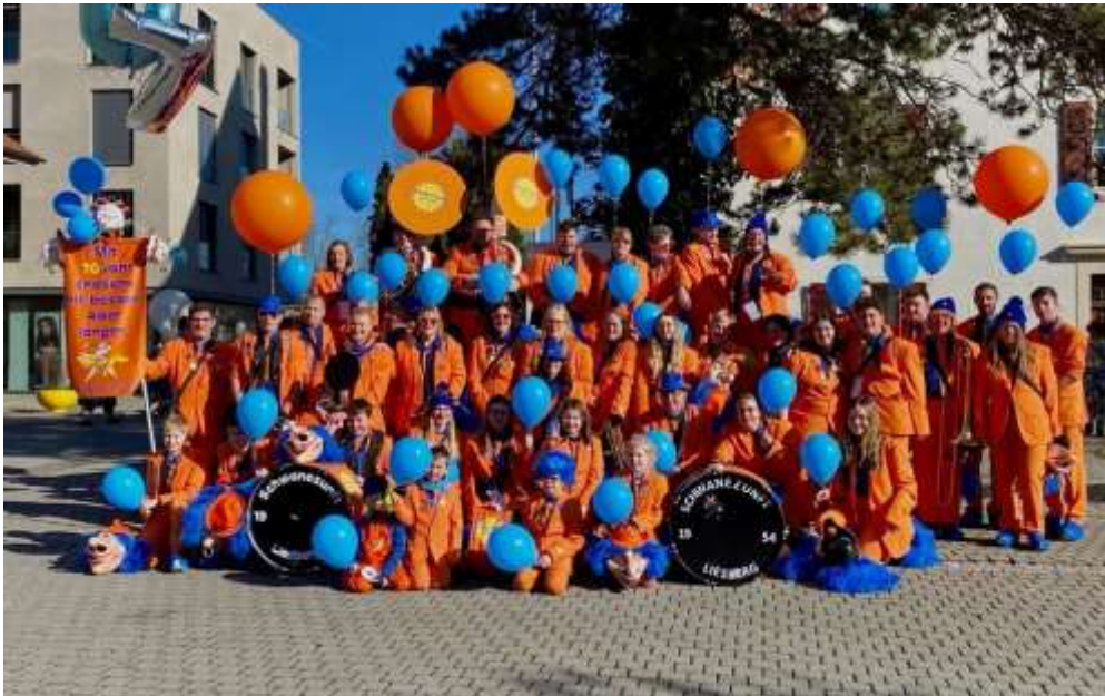
70 Jahre Schwanenzunft – Herzlichen Glückwunsch zum Jubiläum

Berichte und Informationen aus dem Gemeinderat, der Gemeindeverwaltung, der Vereine und der Bevölkerung