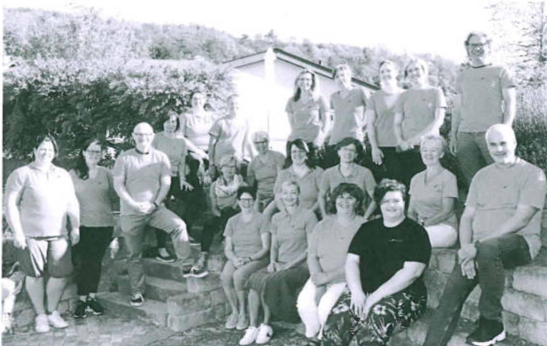
Mitarbeiterinnen, Mitarbeiter und Vorstand