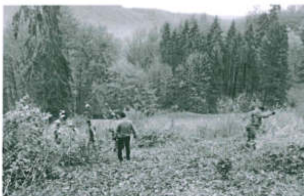
An der Arbeit im Gebiet Schneitlech

Dies alles haben Sie sicher zu Hause. Merken Sie sich die Daten, kommen Sie mit und geniessen Sie die Einsatztage mit uns in der freien Natur. Sie erfahren dabei noch viel Neues über unsere Pflanzenwelt.