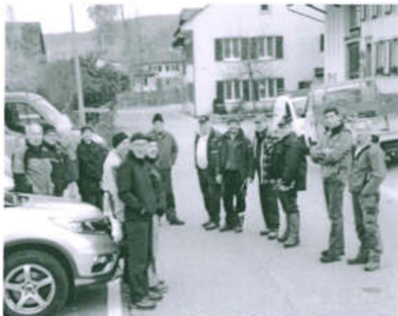
Besammlung um 0800 Uhr beim Brunnen