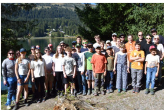
Die Future Band im Jugendmusiklager in Valbella auf der Wanderung entlang dem Heidsee.