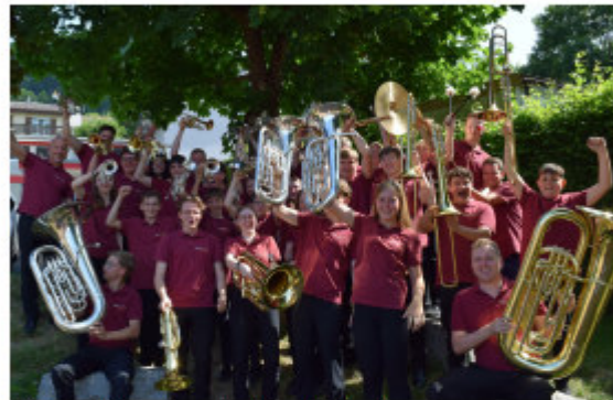
Ein Gesamtfoto am Jugendmusikpreis in Nunningen.

Nun haben wir definitiv genügend geprobt und sind bereit für den Jugendblasmusikpreis am 17. Juni in Nunningen. Unser Ziel ist klar, wir wollen den 1. Platz aus dem Vorjahr verteidigen. Wir treten auf und geben unser Hauptstück „Wall of Sound“ zum Besten. Auch unserem Posauern-Register gelingt mit dem Stück „Frohlic for Trombones“ einen tollen Auftritt. Dank dieser guten Leistung können wir uns auch in diesem Jahr verdient den ersten Platz sichern. Herzlichen Dank nochmals für eure tolle Leistung.