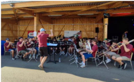
Die Future Band an der Jubiläumsfeier der Elektra Sissach bei heissen Temperaturen.

Kaum die Eindrücke verarbeitet geht es im Eiltempo weiter: Am 3. Juni spielen wir nach dem Probenachmittag bei schönstem Sommerwetter an der Jubiläumsfeier der Elektra Sissach. Es ist ein sehr heisser Nachmittag, welchen einige wohl lieber in der Badi verbringen würden, jedoch erhalten wir für unseren Auftritt viele tolle Rückmeldungen.