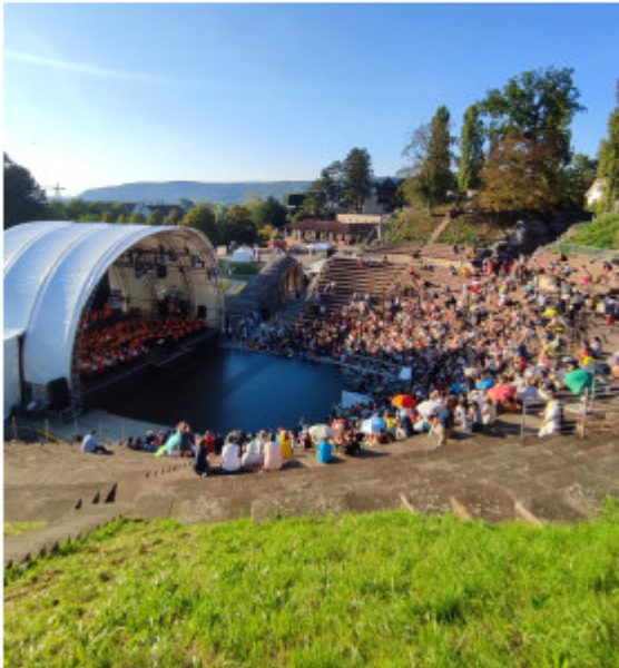
Mausica Raurica: Die Future Band auf der Tribüne mit viele Schüler*innen der Musikschulen Baselland.