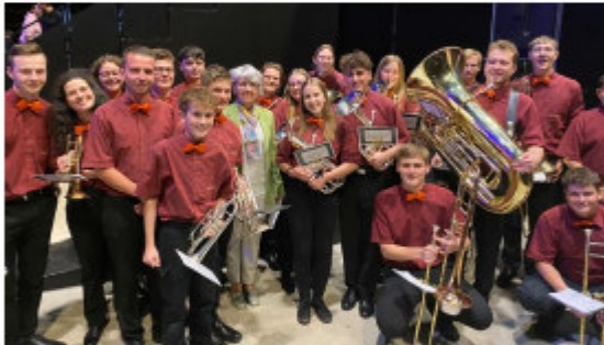
Delegation der Future Band und Elisabeth Baume-Schneider am Europäischen Jugendchor Festival in Basel.

Es folgt sogleich das nächste Highlight: Am 17. Mai darf eine Delegation den Future Band die Eröffnung des 13. Europäischen Jugendchor Festival in Basel umrahmen. In der St. Jakobshalle Basel dürfen wir spielen während 800 Singende die Bühne betreten. Für uns, die Spielenden und auch die Besuchenden ein ganz einmaliges Ereignis. Dass der Anlass eine ganz grosse Sache ist, zeigt auch die Anwesenheit der Bundesrätin Elisabeth Baume-Schneider. Wir lassen uns natürlich ein gemeinsames Foto mit der Bundesrätin nicht entgehen.