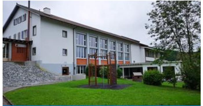
Bildungswesen und Kirche