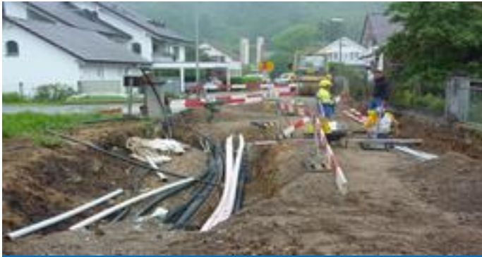
Tiefbau, Werkdienste & Wasserversorgung